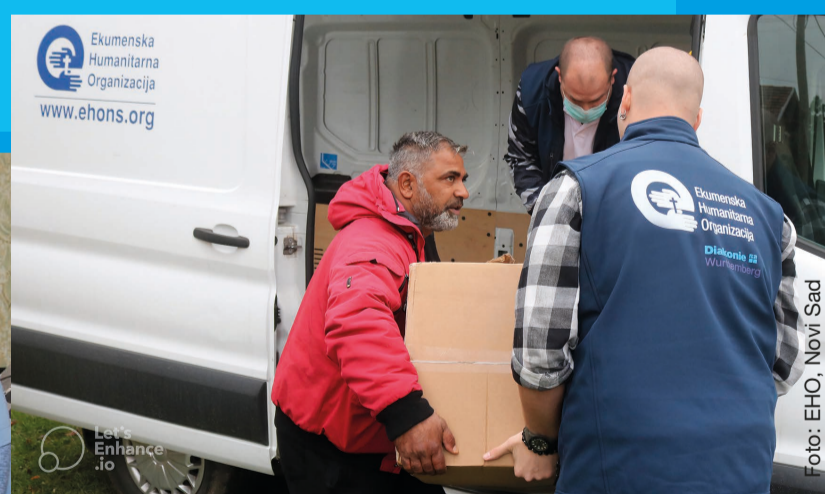
VUK und VLADE packen an in Serbien