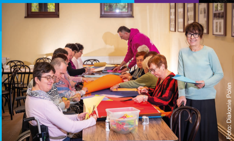
KARINA begeistert in Polen