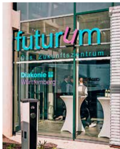
Unterschiedlich gestaltete Räume laden zum kreativen Denken ein.

Mit vielen Gästen, interessanten Impulsen und kreativen Beiträgen hat die Diakonie Württemberg ihr Zukunftszentrum „futurum“ eröffnet.