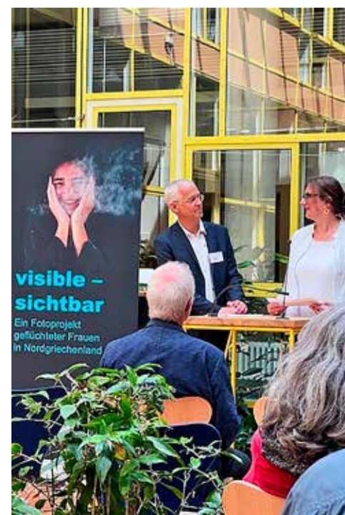
Eröffnung in der Landesgeschäftsstelle

Sie können auch online spenden: www.brot-fuer-die-welt.de/spende