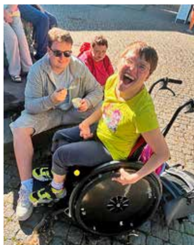
Ob lange Reise, Tagesausflug oder Kurs – der Spaß steht bei den Teilnehmern und den Ehrenamtlichen immer im Vordergrund.